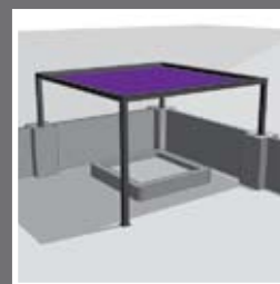
Montage op schutting