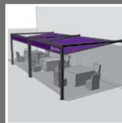
Gekoppeld terras gevel

De mogelijkheden met de Rozendael zijn eindeloos.